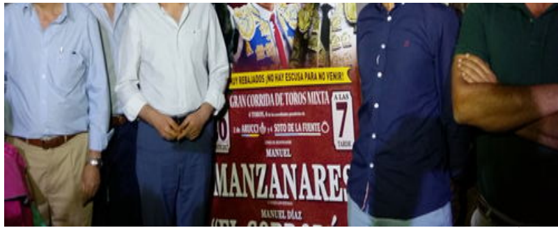
( http://www.aracena.es/export/sites/aracena/es/.galleries/Noticias-agosto-2017/cartel-toros.jpg )