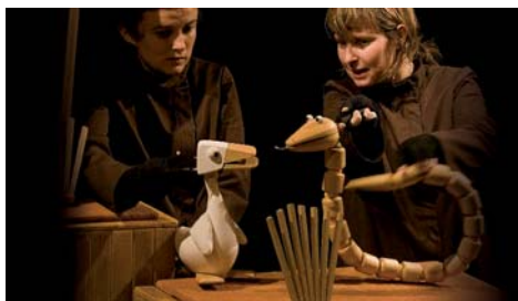
Para alumnos de Educación Infantil

Jue. 23 PERIFERIA TEATRO (Murcia) "Guyi, Guyi"