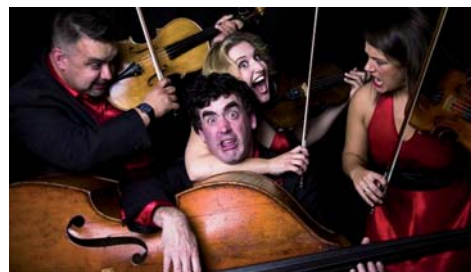
Para alumnos de Secundaria

Mié. 14 THE GRAFFITI CLASSICS (Gran Bretaña) "16 cuerdas con mucho ritmo"